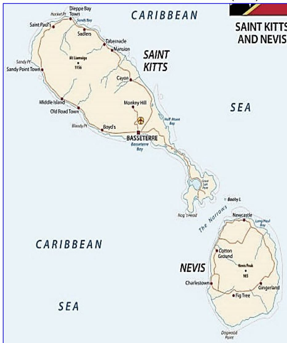
Harta Sfânt Cristofor și Nevis

„Adesea, în fața celor care vor să învețe stă autoritatea celor care predau; pentru a rezolva problema, ucenicii încetează să mai folosească propria lor judecată și acceptă ceea ce consideră că este verdictul maestrului ales. De fapt, nu sunt dispus să accept practica atribuită prin tradiție.” Marcus Tullius Cicero