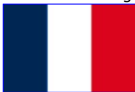
Drapelul Guyanei Franceze