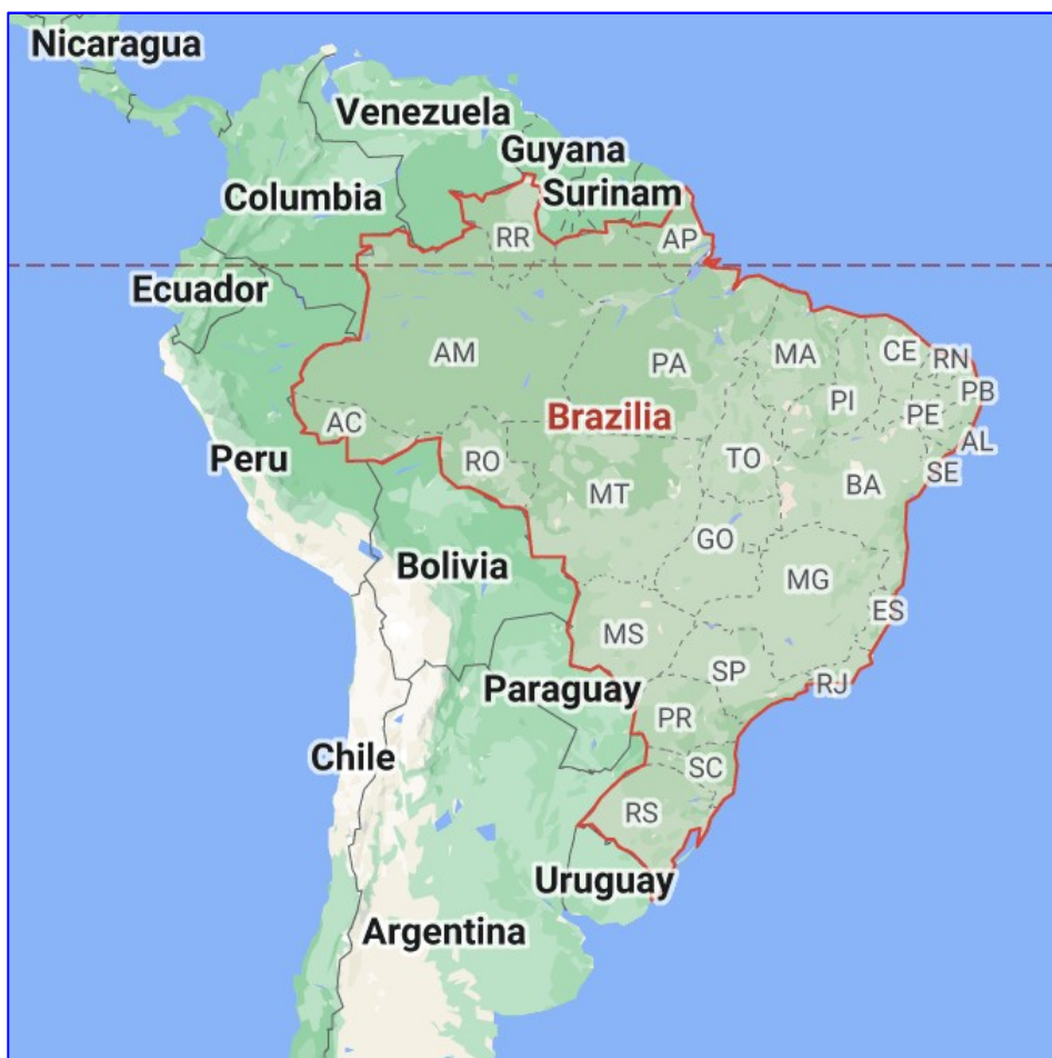
Harta Braziliei (Oceanul Atlantic, în dreapta; Oceanul Pacific, în stânga)

„Biblia este o mulțime de fabule și tradiții, simplă mitologie.” Mark Twain