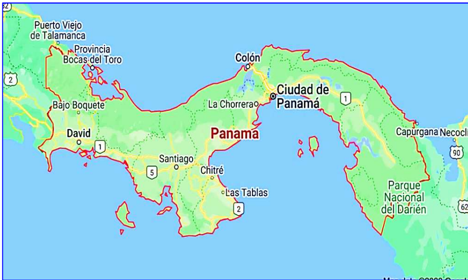
Harta Republicii Panama Republica Panama