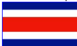
Drapelul Costa Ricăi