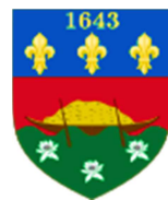
Stema Guyanei Franceze