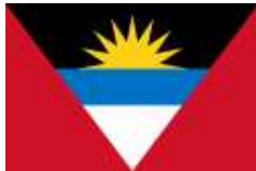
Drapelul Antigua și Barbuda