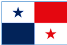
Drapelul Republicii Panama

Deviză: Imnul național: Suprafață- totală Apă (%) Cel mai înalt punct Cel mai jos punct Cel mai mare oraș Vecini Populație- Estimare 2017 Densitate Religii Limbi oficiale Etonim Sistem politic Legislativ Capitala Independența față de Spania Independența față