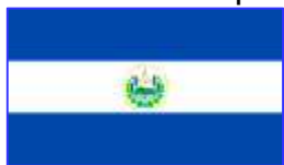
Drapelul Republicii Salvador