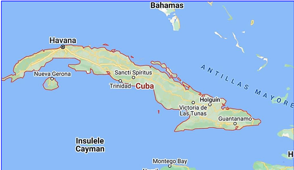
Harta politică a Cubei

Provincii , 1.- Isla de la Juventud, 2.- Pinar del Río, 3.- Havana (La Habana), 4.- Orașul Havana (Ciudad de La Habana), 5.- Matanzas, 6.- Cienfuegos, 7.- Villa Clara, 8.- Sancti Spíritus, 9.- Ciego de Ávila, 10.- Camagüey, 11.- Las Tunas, 12.- Granma, 13.- Holguín, 14.- Santiago de Cuba, 15.- Guantánamo