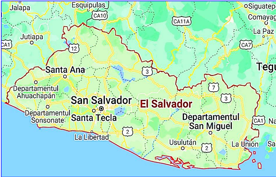
Harta Republicii El Salvador