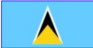
Drapelul Sfintei Lucia