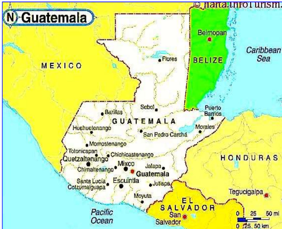
Harta Republicii Guatemala