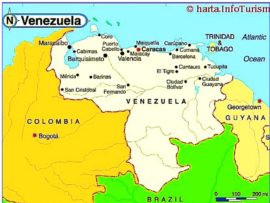
Republica bolivariană a Venezuelei