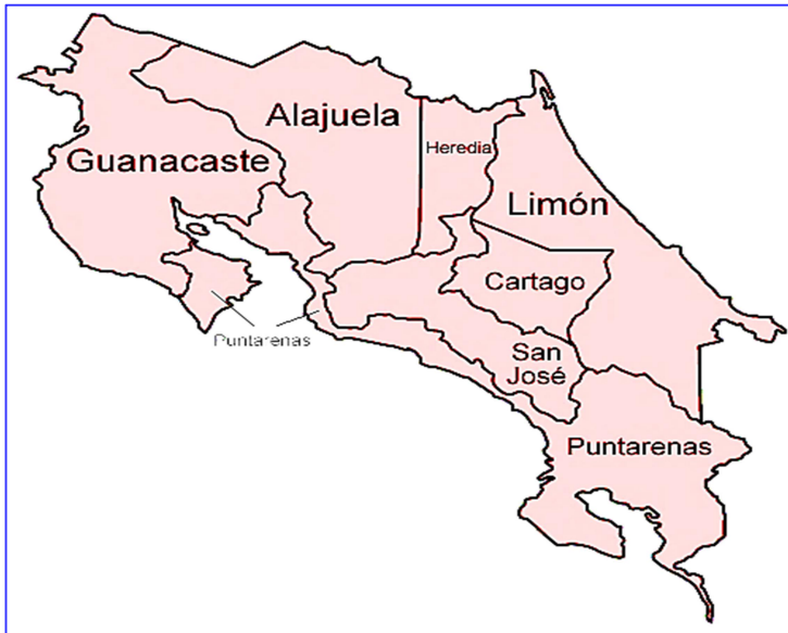
Harta Republicii Costa Rica